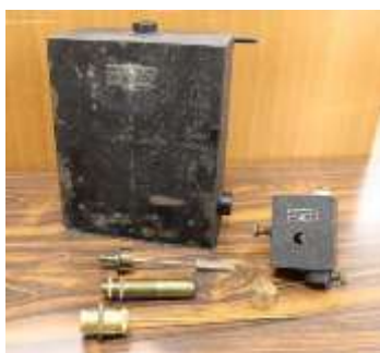
図1 IM 泉効計部品（昭和前期）

IM 泉効計は鉱泉及び気体試料の放射能を測定する機器である。携帯可能で簡便に計測できることから温泉の成分分析に用いられてきた。