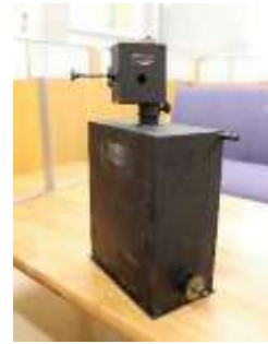
図3 IM 泉効計(昭和前期製造、理研製)

飯盛の手掛けた放射線測定機器は理化学研究所内において研究に必要な器具の製造や研究成果品の製造を担う部門である工作係(後に工作部)によって製造された。IM 泉効計も工作係において製造、販売されたが、のちに理研コンツェルンの一つであった理研計器株式会社が一部製造を担うこととなり、戦後も研究所と共に製造に携わった。