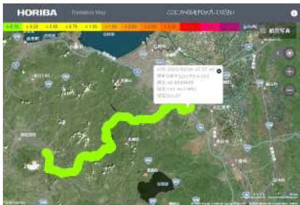
図 宿泊学習で移動したバス内の自然放射線量率

平成 20 年告示の中学校学習指導要領において、約 30 年ぶりに放射線の学習内容が復活し、第 3 学年の理科において放射線について触れることが明記されました。この学習指導要領は平成 24 年度から完全実施となりました。移行措置として放射線に関する内容は、平成 23 年度（2011 年度）の第 3 学年から扱うこととなっており、東北地方太平洋沖地震による福島原子力発電所の事故により学校現場では混乱の中、放射線教育がスタートしました。平成 29 年告示の中学校学習指導要領では、第 3 学年の理科で学習する放射線に関する内容の一部が第 2 学年の理科に移行し、「電流」の単元において「真空放電と関連付けながら放射線の性質と利用にも触れること」と示されました。これまでは、第 3 学年において原子力発電の核燃料から放射線が出るという側面から放射線を扱っていましたが、第 2 学年において科学的に放射線を扱えるようになりました。しかしながら、文部科学省による「はかるくん」の貸出事業は実施されておらず、現場では生徒が実際に放射線の実験をすることはあまり行われていないのが現状です。また、クルックス管による陰極線の演示実験を見て生徒が現象を直接観察することも少なくなっています。その理由は、教科書会社が発行する教師用指導書に「漏洩エックス線が出るために演示実験を行うのが好ましくない」と記載していることも要因の一つになっています。現在、私は管理職（教頭）であるため、理科の授業を担当していませんが、旅行的行事で生徒を引率する際には、簡易放射線測定器を持参して移動中のバスにおいて自然放射線量率を測定しています。実際に生徒が訪れた場所の測定データを示す掲示物（図）を作るなどして、生徒が少しでも放射線を身近に感じるように努めると共に若手理科教員へ授業のアドバイスをしています。