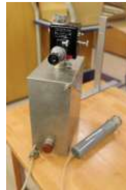
図4 IM 泉効計(昭和38年製造、理研製)