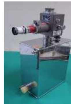
図5 IM 泉効計(昭和45年製造、理研計器製)